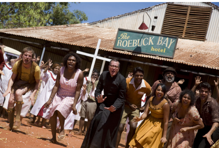
Il cast di Bran Nue Dae canta "Nothing I'd Rather Be"

La cultura aborigena ha sempre più seguito a livello internazionale. Dopo il successo di Australia Today , la mostra di arte indigena che ha recentemente avuto