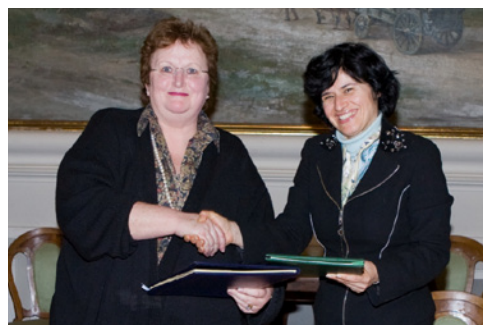
L'Ambasciatore Amanda Vanstone ed il Segretario di Stato di San Marino per gli Affari Esteri, Antonella Mularoni, durante la firma dell'accordo fiscale

“Questo accordo con San Marino soddisfa i requisiti standard per lo scambio di informazioni fiscali sviluppati dall'OCSE e approvati dal G20 e dalle Nazioni Unite”, ha dichiarato il Vice Ministro. Il TIEA entrerà in vigore dopo che l'Australia e San Marino avranno soddisfatto i rispettivi requisiti a livello nazionale. Per ulteriori informazioni, visitate il sito del Vice Ministro australiano per il Tesoro .