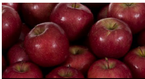
Mele Crimson Snow