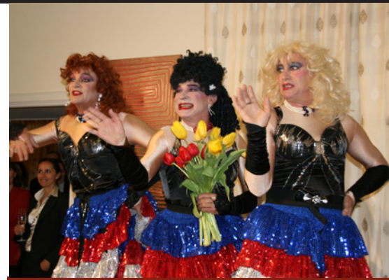
Esibizione delle Sorelle Bandiera al ricevimento 'Grazie Italia'

Il vincitore italiano della medaglia d'oro di nuoto olimpico, Massimiliano Rosolino , è stato l'ospite d'onore, insieme al padre italiano e alla madre australiana. Massimiliano è un perfetto esempio di legame sportivo tra Italia e Australia, essendosi allenato per diversi anni in