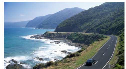
La Great Ocean Road nel Victoria

Vuoi studiare in Australia? Sono aperti anche i bandi per le borse di studio Endeavour Awards 2011 .