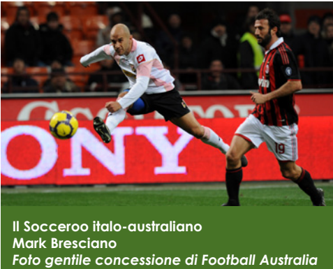
Il Socceroo italo-australiano Mark Bresciano

Il più grande evento sportivo del momento è naturalmente rappresentato dai Mondiali di calcio in Sud Africa , che hanno visto impegnate l'Italia e l'Australia. La composizione della squadra australiana rivela la natura multiculturale del paese, avendo diversi giocatori con doppia nazionalità che hanno scelto di giocare per l'Australia.